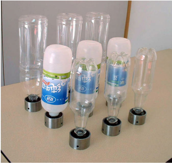
图 1. 制作完成的瓶体透湿性检测试验样品