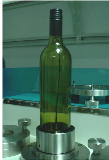
图 2. 制作完成的容器整体透湿性检测试验样品

之后将传感器法薄膜透湿性测试设备中的测试上腔更换为特定外罩（与设备配套），然后安装上制备好的试验样品将渗透腔隔成两个独立的气流系统（参见图 3）。这样在容器一侧为流动的载气（干燥），另一侧保持一定的相对湿度，样品两侧水蒸气浓度不同，存在稳定的水蒸气浓度差（相对湿度差）。在水蒸气浓度差（相对湿度差）的作用下，水蒸气透过容器壁并被载气流携带至传感器中，由传感器精确测量出载气流中的水蒸气含量，从而计算出试验样品的水蒸气透过率。